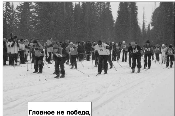
Главное не победа, а участие

Более остро развернулась борьба на дистанции смешанной эстафеты. Первый этап быстрее всех преодолел представитель шахты «Березовская». Вторым с большим отставанием эстафету передает представитель шахтоуправления «Анжерское». Но женщины «Березовской» не сумели удержать лидерство.